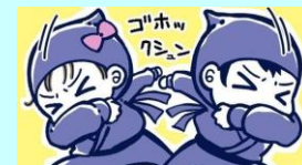
イラスト：青鹿ユウ

咳をする時、口元を手のひらで覆っていませんか？実はこれは、多くの人がしている誤った咳エチケット。咳の飛沫で出た菌やウイルスを手で受け止めると、そこから感染を広げてしまいます。園では、咳をする時は、右図のように、「忍者に変身！」スタイルなど、咳を腕で防ぐことを子ども達に勧めています。