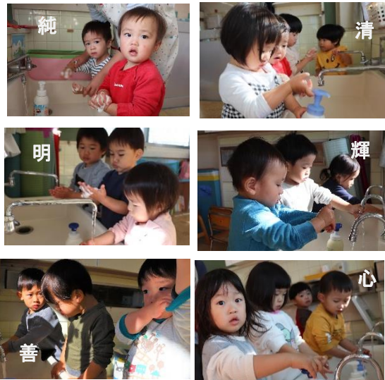
＜発達別到着目標＞ 光明看護師会作成